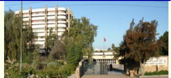
Faculté de Médecine et de Pharmacie de Rabat