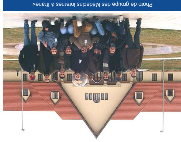
Photo de groupe des Médecins internes à Ifrane

«Ces journées sont incontournables de rencontres et d'échanges entre les différentes spécialités et témoignent d'une volonté de formation exemplaire de la part de ces jeunes médecins.»